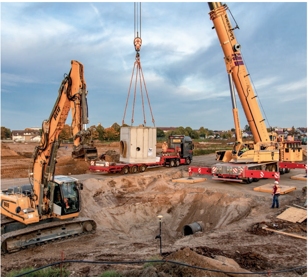
Einbau Schachtelement in der Vöklinger Achse

Die Arbeiten für die Erschließung sind gemäß Zeitplan im Spätsommer gestartet. Seitdem werden Kanäle, Schächte, Fernwärme- und Wasserleitungen gelegt. In den nächsten Wochen folgen Strom- und Glasfaserleitungen.