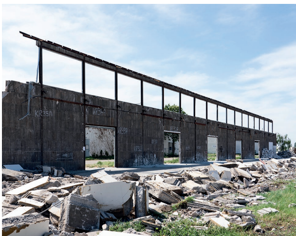
Abbruch der ehemaligen Lagerhallen auf SPINELLI

Zudem werden noch zwei Gebäude südlich der U-Halle zurückgebaut. Der Abbruch wird im Dezember 2020 abgeschlossen sein.