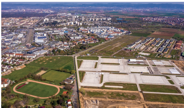
Luftbild des Bereichs um die Anna-Sammet-Straße

Der Mannheimer Gemeinderat hat am 6.10.2020 den Bebauungsplan für den Teilbereich „Anna-Sammet-Straße Süd“ mit der zugehörigen Satzung beschlossen. Mit dem dadurch vorliegenden Baurecht für den ersten Bauabschnitt steht der Realisierung von dringend benötigtem Wohnraum bis 2023 nun nichts mehr im Wege. Parallel zum Bebauungsplanverfahren haben wir über ein Konzeptverfahren zusammen mit der Planungskommission SPINELLI die Investoren für den ersten Bauabschnitt gefunden. Dabei lag der Bewertung der Konzepte ein besonderes Augenmerk unter anderem auf den Themen Architektur, Nachhaltigkeit und dem Angebot an preisgünstigem Wohnraum.