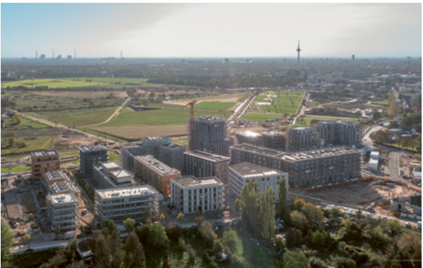
Blick auf SPINELLI

Die ersten Wohngebäude sind teilweise schon bezogen, weitere stehen kurz vor Abschluss und Übergabe: Neben dem studentischen Wohnen am Chisinauer Platz gibt es in 32 neuen Wohnungen – jeweils 16 im Punkthaus von BPD an der Leonie-Ossowski-Promenade und im zweiten evohaus-Gebäude an der Anna-Sammet-Straße – neue Nachbar*innen auf SPINELLI. Auch die gemeinschaftlichen Wohnprojekte Oikos und Neighborwood stehen kurz vor dem Bezug – genau wie das Bumerang-Gebäude am Chisinauer Platz.