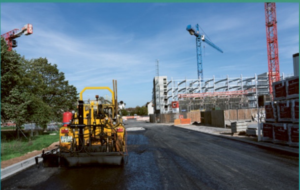
Asphaltierarbeiten um SPINELLI.

Der Straßenendausbau in und um SPINELLI schreitet voran. Endlich ist die Dürkheimer Straße wieder befahrbar, nur der südliche Gehweg auf Höhe der Quartiersgarage wird erst mit deren Fertigstellung endausgebaut. Mit der Völklinger Straße Nord geht es im Außenbereich von SPINELLI nahtlos weiter. Hier verläuft der künftige Radschnellweg, der eine komfortable Wegeverbindung zur Innenstadt, nach Viernheim und Weinheim ermöglicht. Die vier Meter breite Rad-Fahrbahn verläuft parallel zur Bebauung und wird mit einem Park- und Grünstreifen von der restlichen Straße abgetrennt. Innerhalb von SPINELLI arbeiten wir am Rest der Völklinger Straße. Auch auf dem Chisinauer Platz geht es nach acht Wochen Stillstand weiter. Hier musste die Planung für das Entwässerungskonzept zum Schutz einer Fernwärmeleitung überarbeitet werden. Im neuen Jahr heißt es dann: Alle Kräfte zum Quartiersplatz, auf dass er rechtzeitig fertig wird. Ein paar gedrückte Daumen nehmen wir neben den zusätzlichen Kapazitäten aber gern, um den Verzug aufholen zu können.