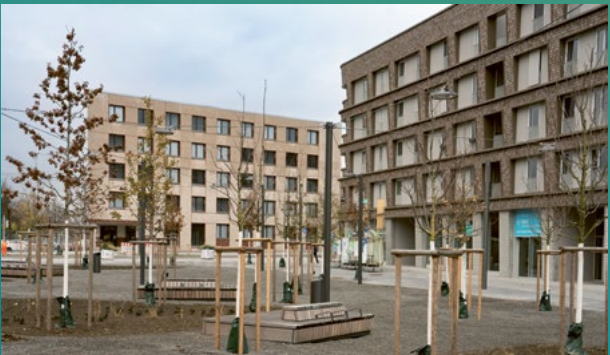
Chisinauer Platz

Mit dem fertiggestellten Chisinauer Platz erhalten SPINELLI und Käfertal-Süd ein besonderes Zentrum. Stück für Stück wird der Platz zum lebhaften Herz des Quartiers. Die Apotheke ist bereits eröffnet, andere Geschäfte werden folgen. So sollen ein Rewe-Markt, eine Bäckerei und eine Kita ins Quartierszentrum (Königskinder) einziehen. Aber der Chisinauer Platz ist nicht nur zentraler Treffpunkt und wichtiger Begegnungsraum, auf dessen Sitzflößen man mit anderen ins Gespräch kommen kann. Er dient zudem als kühlende Mitte von SPINELLI und Überflutungsschutz. Anfallendes Regenwasser wird nicht nur in die Parkschale geleitet, sondern auch auf den niedriger gelegenen Quartiersplatz, wo es über die Baumrigolen und die wassergebundene Wegedecke versickert. Unter der Wegedecke speichert eine Schicht aus großporig eingebrachtem Split das Sickerwasser und versorgt die 53 Klimabäume des Stadtwalds. SPINELLI ist eines der ersten Quartiere, die im Südwesten nach diesem System gebaut werden. Somit ist das Wohngebiet für sogenannte hundertjährige Regenereignisse bestens gerüstet.