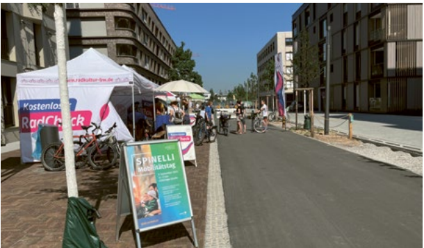
Radcheck beim SPINELLI Mobilitätstag.

Bereits zum zweiten Mal lädt die MWSP zum SPINELLI Mobilitätstag ein. Am Samstag, den 20. April, gibt es von 11 bis 17 Uhr wieder zahlreiche Aktionen und Informationen rund um die Fortbewegung. Am Chisinauer Platz bietet der Allgemeine Deutsche Fahrradclub (ADFC) eine Codieraktion zum besseren Schutz vor Diebstahl und die CHANCE Mannheim ist mit einem Sicherheitscheck für Fahrräder vor Ort. Die rnv und FRANKLIN Mobil informieren über ihr Angebot für SPINELLI und Käfertal-Süd: Über den ÖPNV mit Stadtbus, den On-Demand-Shuttle fips, über die Mieträder von VRNnextbike sowie die E-Leihfahrzeuge von FRANKLIN Mobil, die auf SPINELLI bereitstehen. Um das leibliche Wohl der Besucher*innen kümmert sich das Restaurant Granatapfel.