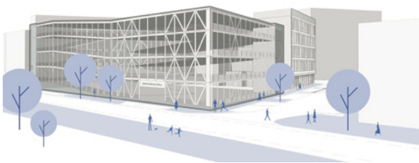
Visualisierung der neuen Quartiersgarage (©bb22 architekten + stadtplaner)

Vollständig in Holzbauweise gehalten, soll die Garage insgesamt 280 Stellplätze bereitstellen. Davon sind 50 Stellplätze öffentlich nutzbar und gebührenpflichtig. Die weiteren 230 Plätze sind als Dauerstellplätze vorgesehen, die von der Betreibergesellschaft selbst verwaltet werden. Ein schrankenloser Betrieb mit automatischer Kennzeichenerfassung sorgt für bequeme Nutzbarkeit.